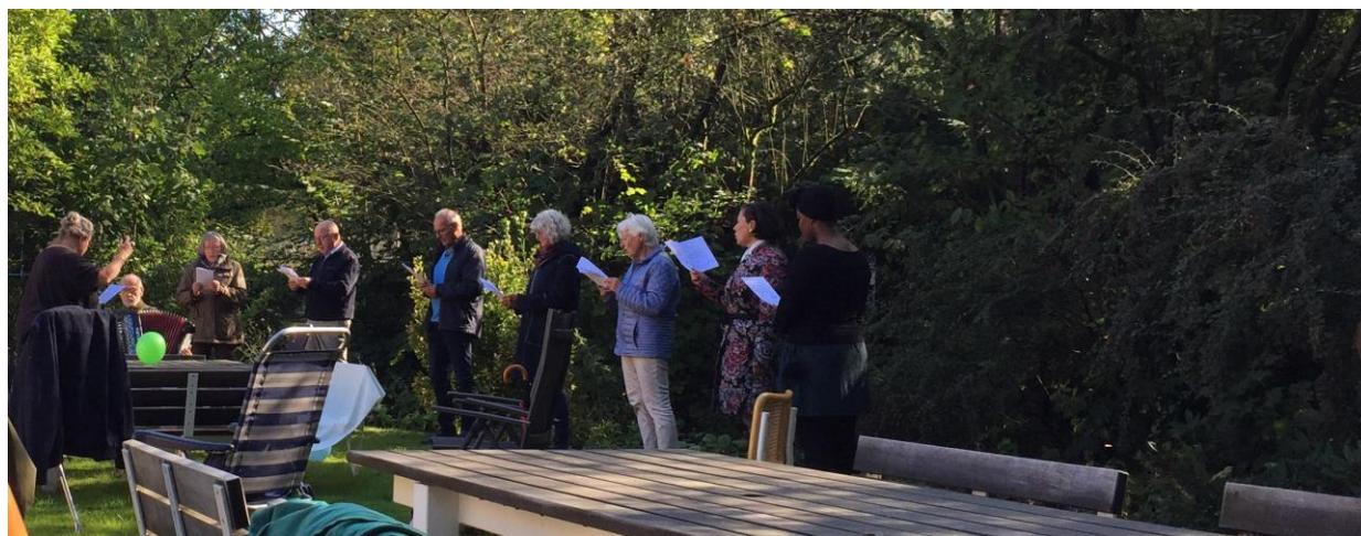
Er mocht weer gezongen worden op 6 september 😊