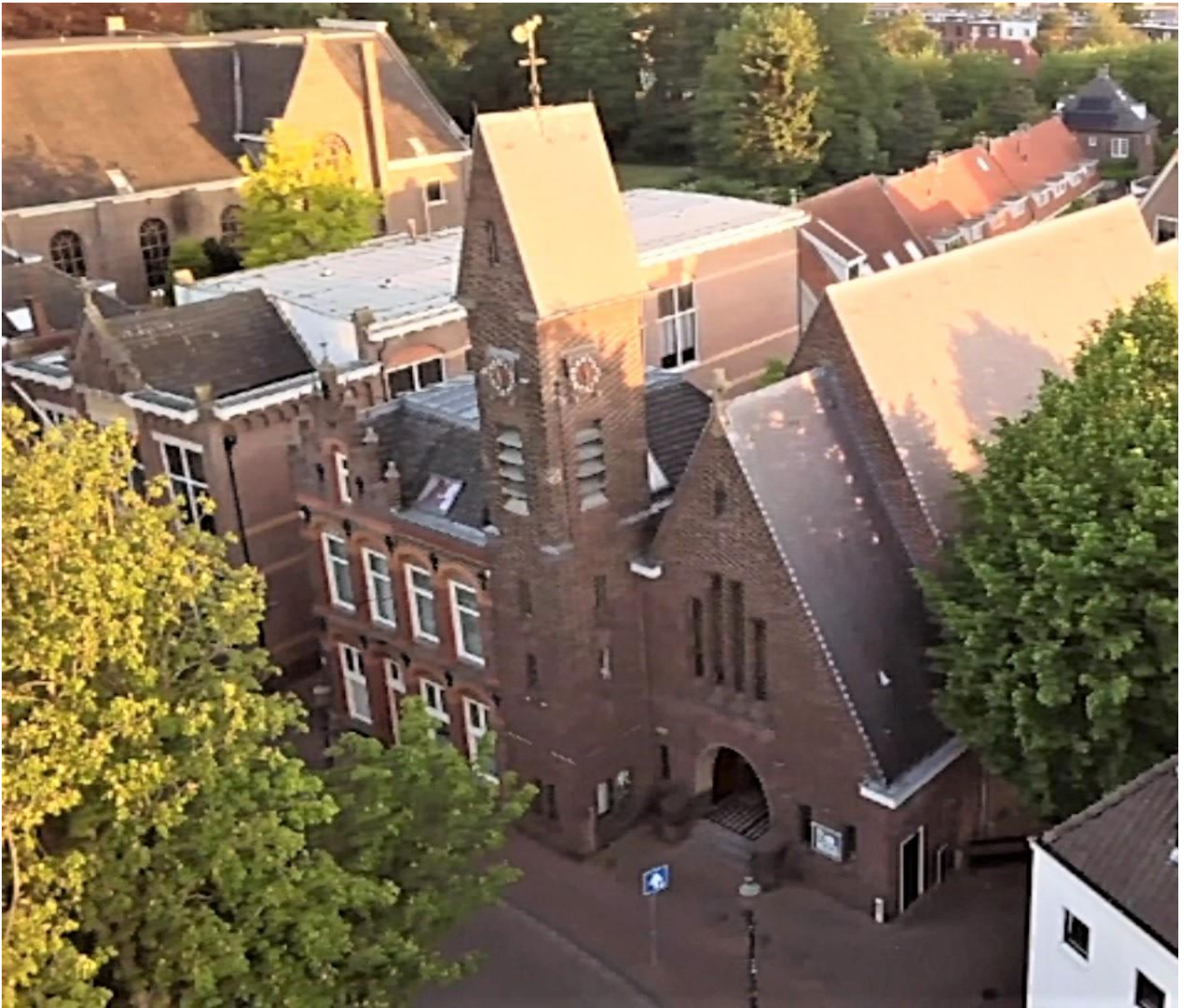
Terugblik op "Zie je zondag!" (blz. 10 e.v.)